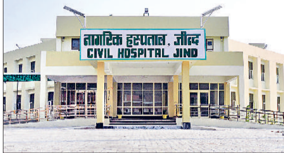
जींद। नागरिक अस्पताल का भवन।