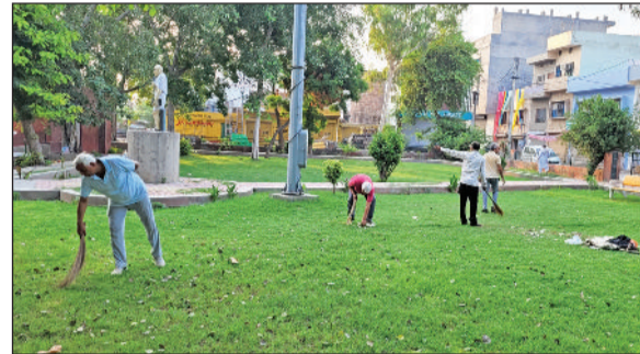
जीद। पार्क में श्रमदान करते हुए सेव संस्था सदस्य।