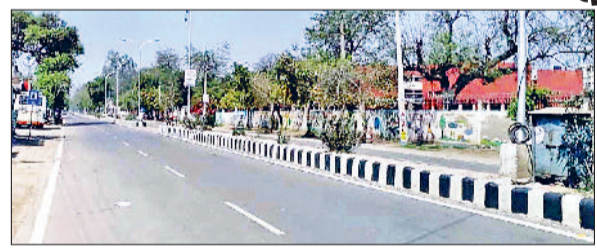
जींद। सुनसान नजर आ रहा सफ़ीदों रोड।

उमस भरी गर्मी ने आमजन का जीना बेहाल कर दिया है। हालांकि अब तक केवल जुलाई माह में दो बार ही बारिश हुई है। बारिश के बाद से लगातार मौसम में उमस बनी हुई है। जिससे लोगों के पसीने सूखने का नाम नहीं ले रहे हैं। वहीं किसानों के लिए भी परेशानी बनी हुई है। किसानों ने धान रोपाईं तो कर दी है लेकिन अब पानी के लिए महंगा डीजल फूंक कर सिंचाई करनी पड़ रही है। दोपहर को शहर में हालात क़रपू जैसे दिखाई दिए। सड़कें खाली रही तो बाजार में भी विरानगी छाई रही। मौसम विभाग के अनुसार आगामी चार दिनों तक मौसम