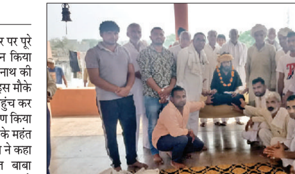
जीद। मंदिर में साधु को सम्मानित करते ग्रामीण।