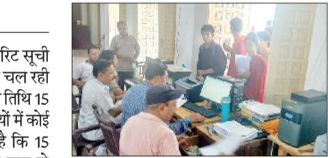
कैथल। आरकेएसडी कॉलेज में दाखिला लेते विद्यार्थी।