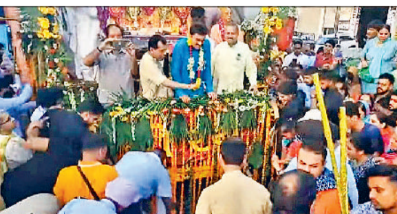
कैथल। भगवान जगन्नाथ यात्रा में भाग लेते श्रद्धालु।